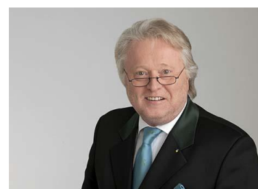
Andreas Eggenwirth © Forum Trinkwasser

Wenn mehr Gäste Trinkwasser bestellen, werden es mehr Restaurants anbieten © razmarinka_123rf.com